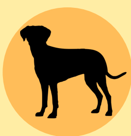
Perro Vector Potencial