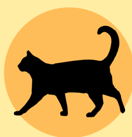
Gato Vector Potencial