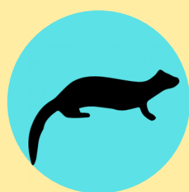
Mangosta Reservorio Natural en Puerto Rico